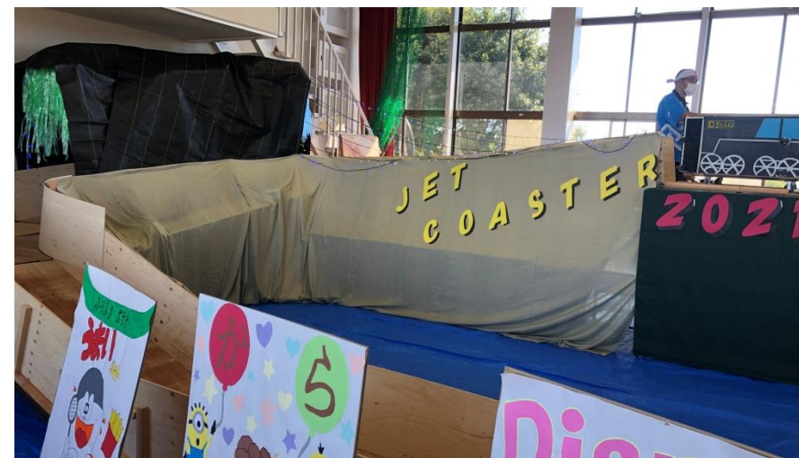
右上の車に乗って出発 トンネルをくぐって終点です。

体育館では、入口に第24回愛育園祭のアーチが作られ、子どもたちと職員が工夫した露店の看板が子どもたちを待っていました。出し物はたくさんあって、どれも楽しいのです。入って左側には、ジェットコースターがあります。今年は、誘われて乗ってみました。スリル満点でしたよ。お昼は、女の子の出し物の綿あめやディズニーチュロスなどを、搗き立ての柔らかいお餅と豚汁と共にいただきました。それぞれとっても美味しかったです。終わってからの感想会もみんなの思いが込められていて、愛育園祭が普段の生活にきっと生きると思いました。